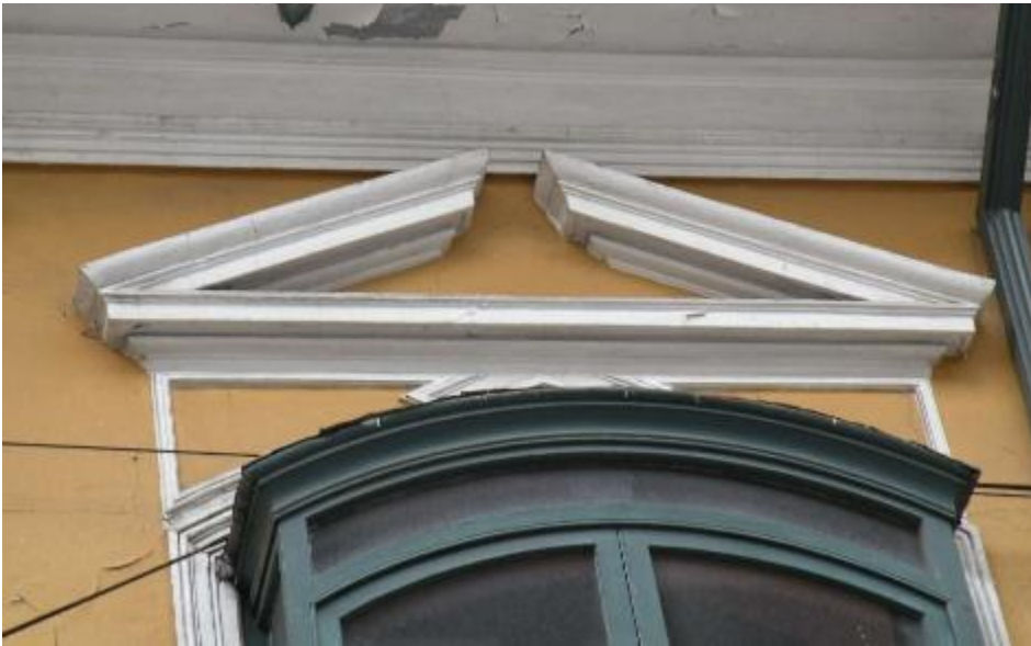
Espacio triangular de un

frontón comprendido entre las cornisas inclinadas del tejado y la horizontal del entablamento. Cada uno de los espacios triangulares del muro que cargan sobre un arco de puerta, comprendido entre la línea del trasdós y la moldura horizontal que corre sobre el arco. En las arcadas, los triángulos curvilíneos formados por los arranques de dos arcos adyacentes y la cornisa.