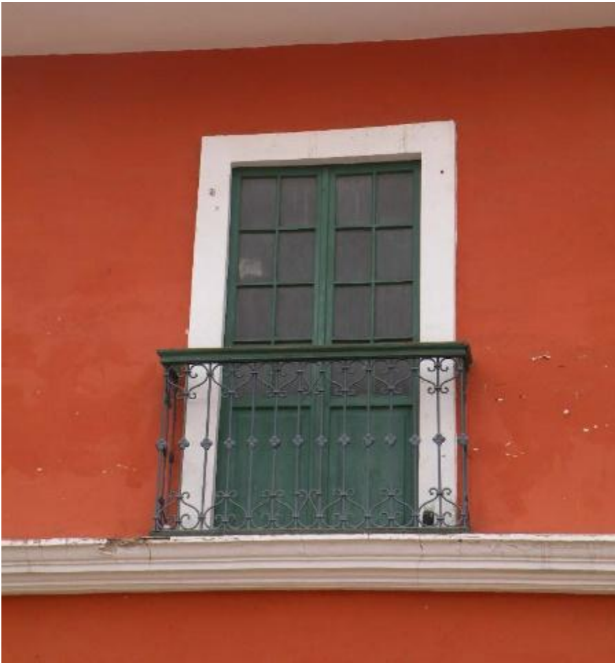
Superficie superior en un

vano de puerta o ventana que no es articulable co la hoja y se decora con tracería, reklieve o pintura.