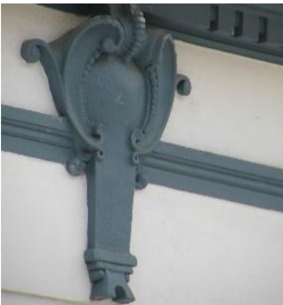
Elementos decorativos de forma oval rodeados de