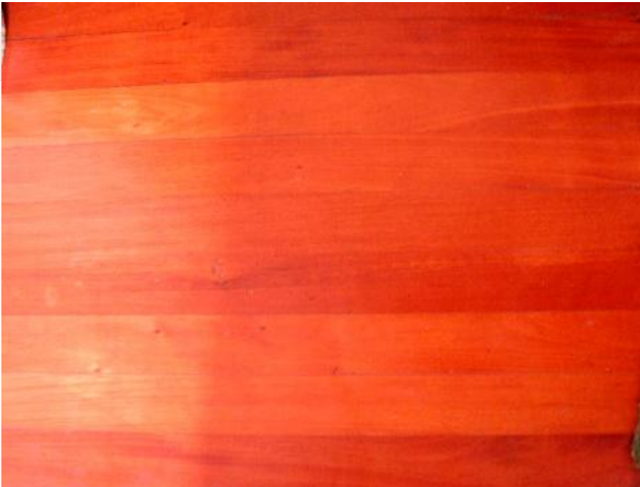
Ensambladura a ranura y

Bloques de madera incorporados a los muros de fábrica y a los que pueden ir fijados la tabiquería y uniones. También llamados bloques de anclaje.