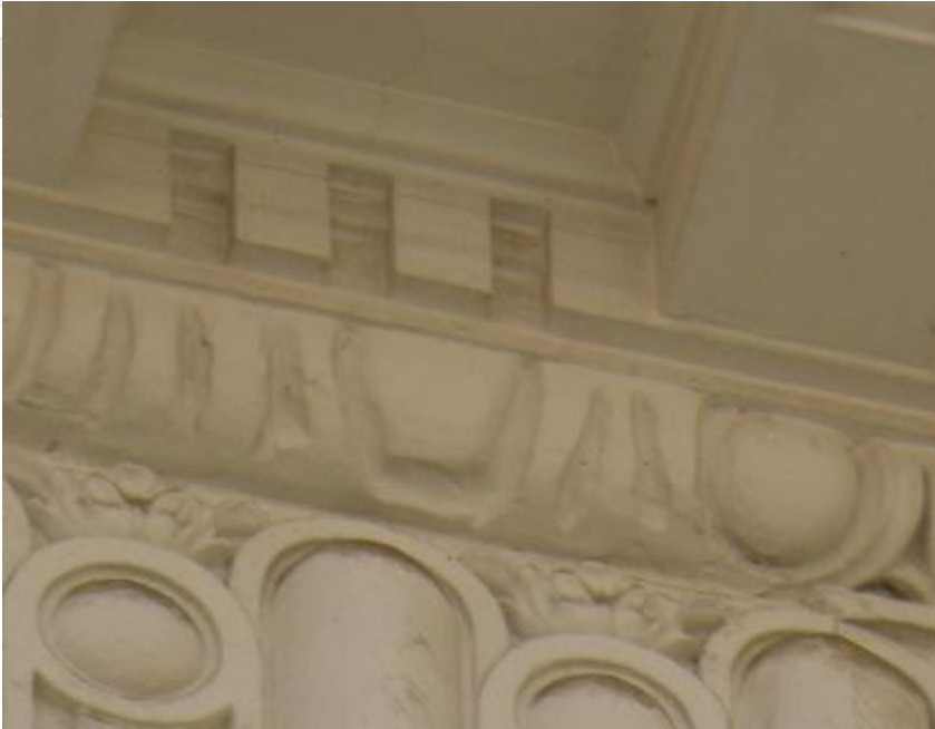
Moldura decorativa a base de ovas

Moldura cuyos bordes se encuentran biselados para su mejor acoplamiento en esquinas.