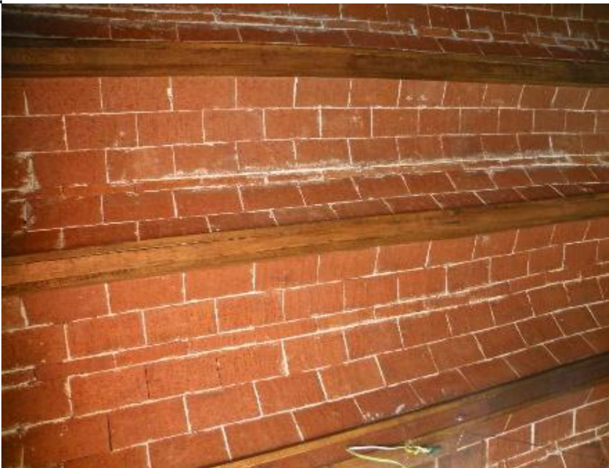
Bloque de material utilizado

para edificar o pavimentar. Están hechos con arcilla o de una mezcla de ella, moldeados en bloques, que adquieren dureza durante su secado al sol o cocidos.