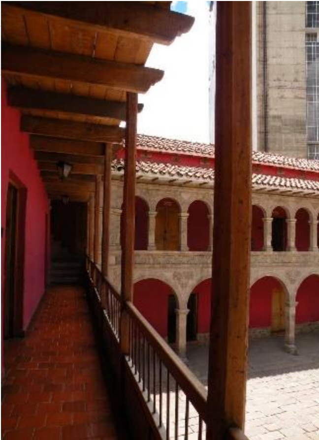
Estructura de madera rustica o rolliza en forma

Lenguaje arquitectónico puesto en práctica del siglo XIX entre el periodo del neoclásico y los inicios del Art Nouveau. Se caracteriza por la utilización de formas del pasado, la reproducción de sus modelos compositivos, la recuperación de su carácter simbólico y la aplicación de sus motivos decorativos, manejando los estilos pasados en su forma pura o combinada entre sí.