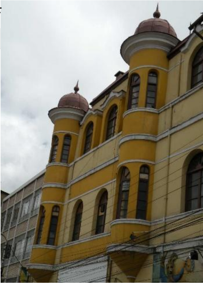
Parámetro exterior de un edificio,

especialmente el principal. También llamado en latín "Frontis".