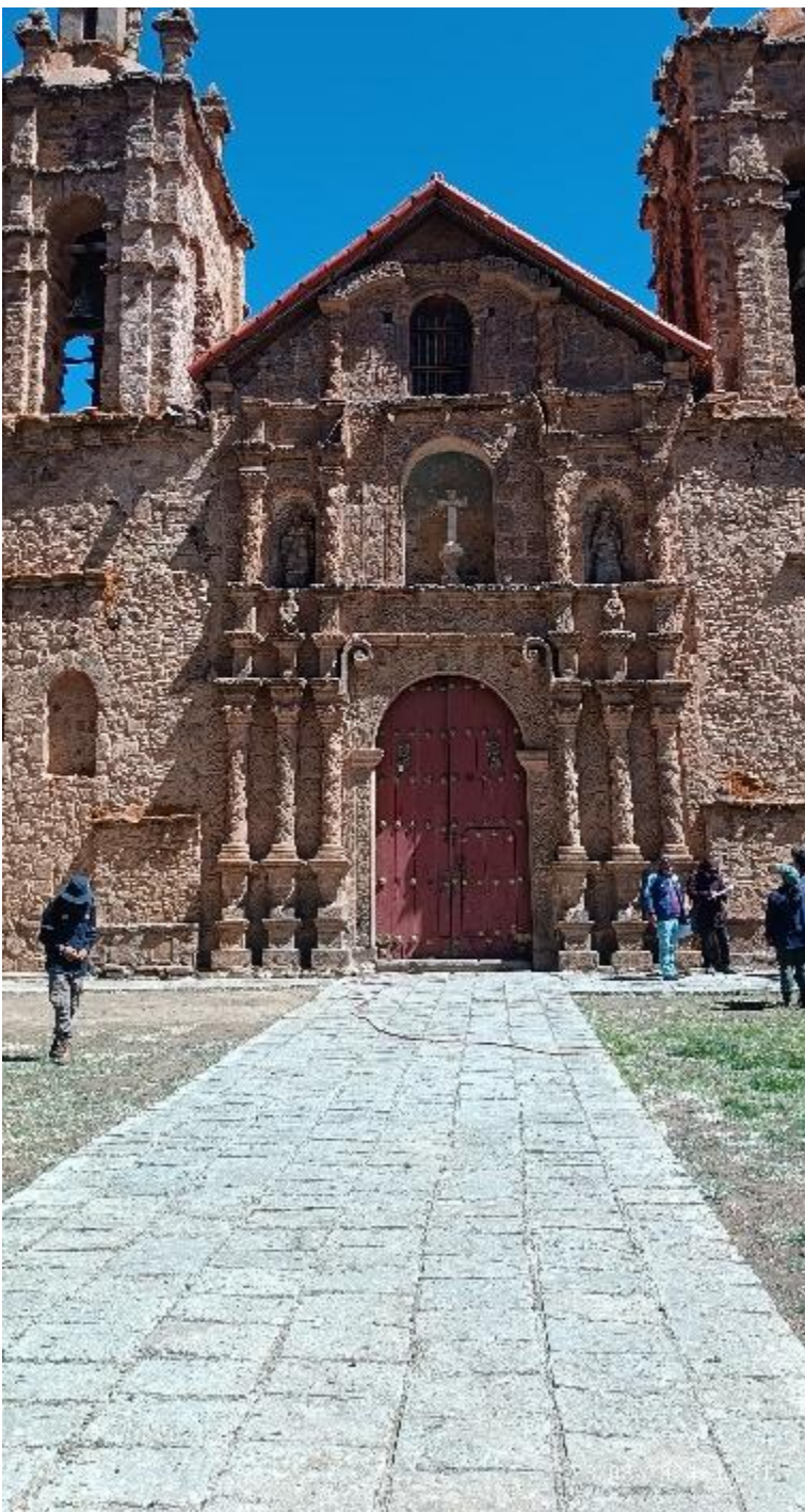
Fachada principal de un edificio.