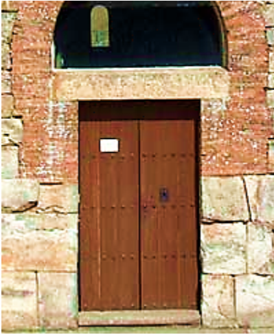
Pieza de madera, piedra o acero situada horizontalmente a través del

borde superior de los vanos de puertas y ventanas, que soportan las cargas del muro que se encuentra sobre ellas.